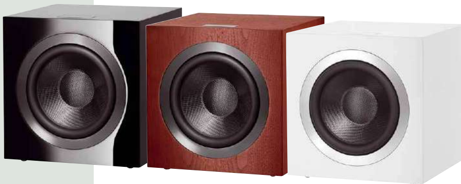
Seine exzellente Verarbeitung macht den DB4S zu einem echten Schmuckstück im Wohnraum

Die untere Grenzfrequenz von 20 Hertz verblüfft bei diesem kompakten Subwoofer, unterschiedliche Presets verändern die klangliche Abstimmung (Neutral, Film, Musik, benutzerdefiniert).