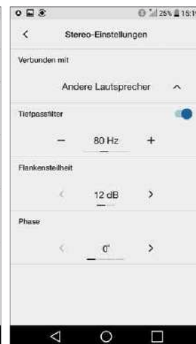
Einstellungen für Trennfrequenz, Flankensteilheit und Phase erlauben die Anpassung an jeden Lautsprecher und Hörraum