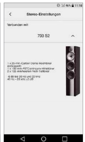
Besitzer von B&W-Lautsprechern können ganz einfach ihr vorhandenes Modell auswählen, die dazu passenden Einstellungen werden automatisch gemacht