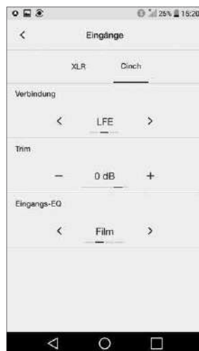
Die Grundeinstellungen lassen sich komfortabel per App erledigen

Mit Kantenlängen von gerade einmal 370 Millimetern ist das nahezu kubische Gehäuse des DB4S eher handlich, auch verleitet die exzellent ausgeführte Lackierung (in Hochglanzschwarz, Satinweiß oder Nussbaum erhältlich) zu einer sichtbaren Platzierung im Wohnraum – der DB4S ist nämlich ein echtes Schmuckstück! In dem geschlossenen Gehäuse des Aktivwoofers arbeitet ein Hochleistungstreiber mit einer 200 Millimeter messenden Membran aus „Aerofoil“. Hierbei wurden in einem Sandwichverfahren zwei unterschiedlich geformte Membranen aus Pappe mit einer Zwischenschicht aus EPS verklebt. Das Ergebnis ist ein Tieftöner, dessen Membran enorm stabil und gleichzeitig federleicht ist – ein Garant für präzise und