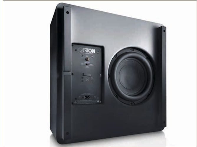
Auf der Unterseite finden wir einen LFE-Anschluss, den wir aber kaum nutzen, da der Sub sich kabellos an die Soundbar koppelt

auf der Unterseite eine Buchse für das Stromkabel und einen Cinch-Eingang. Dieser kommt bei uns jedoch gar nicht zum Einsatz. Schließlich binden wir den Subwoofer kabellos ein. Ein kleiner Kippschalter zur Steuerung des Eingangs komplettiert das Äußere des Subwoofers. Die Verbindung geht wirklich spielend leicht. Wir navigieren im Menü der Soundbar zum Lautsprecher-Setup, wählen den Kanal „Subwoofer“ aus und schließen den Smart Sub 10 ans Stromnetz an. Nach wenigen Sekunden haben sich beide Geräte gefunden und koppeln automatisch. Schon steht die Verbindung – wirklich smart!