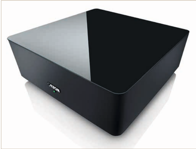
Der Subwoofer ist so flach gestaltet, dass er sogar unter dem Sofa platziert werden kann